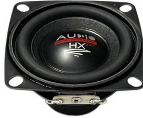
EX 50 SQ EVO3